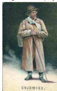
Kujawiak w grafice